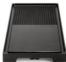
Placa de parrilla antiadherente