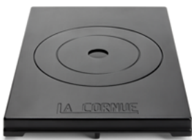
Placa de cocción lenta