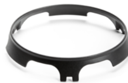
Anillo para wok